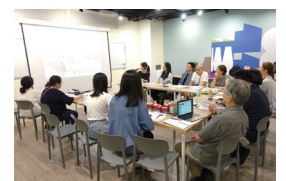
⑦ 文化資産実務研究会