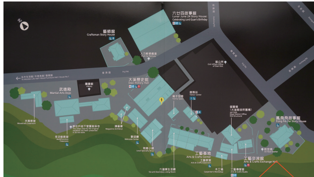
② 大溪老街（上段）/警察の旧官舎群を活用した大溪木芸生態博物館（下段）