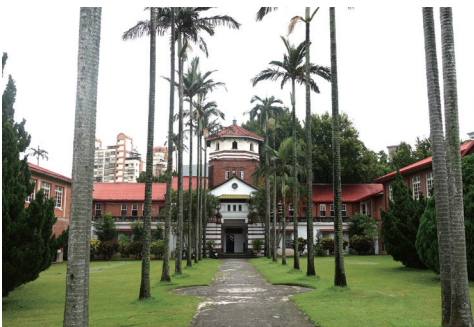
③ 私立淡江高級中学

会場 YURIN LOUNGE(矢野園隣り) 群馬県桐生市本町2丁目8-26 桐生歴史文化資料館 2F